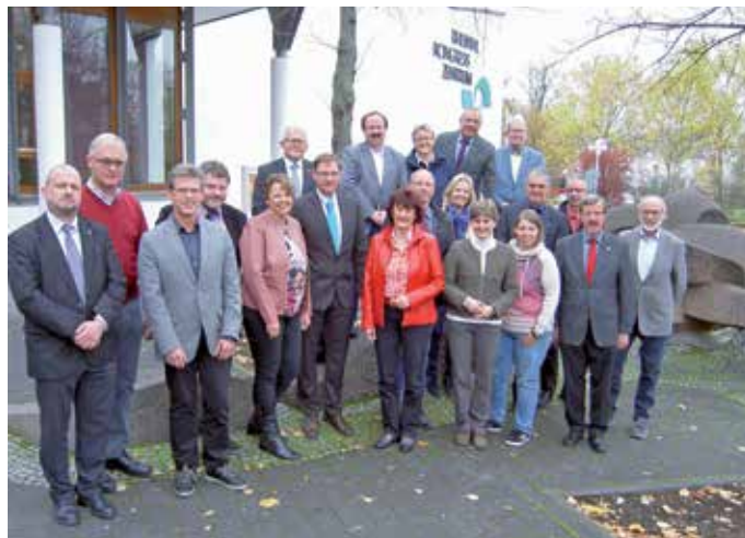
> Die Teilnehmerinnen und Teilnehmer der Sitzung des Landesvorstands in Bingen.

Auch objektiv ist dringender Handlungsbedarf erkennbar. Immer komplexere Aufgaben und damit steigende Arbeitsverdichtung werden allgemein nicht ausreichend bei der Personalausstattung berücksichtigt, sodass ein hohes strukturelles Stellenbesetzungsdefizit zu verzeichnen ist bzw. weitere Stelleneinsparungen aufgetretene Defizite gerade noch verschärfen würden. Erwähnt werden brauchen aus jüngster Zeit