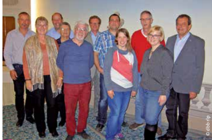
> Die dbb arbeitnehmervertretung rheinland-pfalz.

Am 23. Oktober 2017 trafen sich die Arbeitnehmervertreterinnen und -vertreter der dbb Mitgliedsorganisationen zu ihrer turnusmäßigen Herbstsitzung.